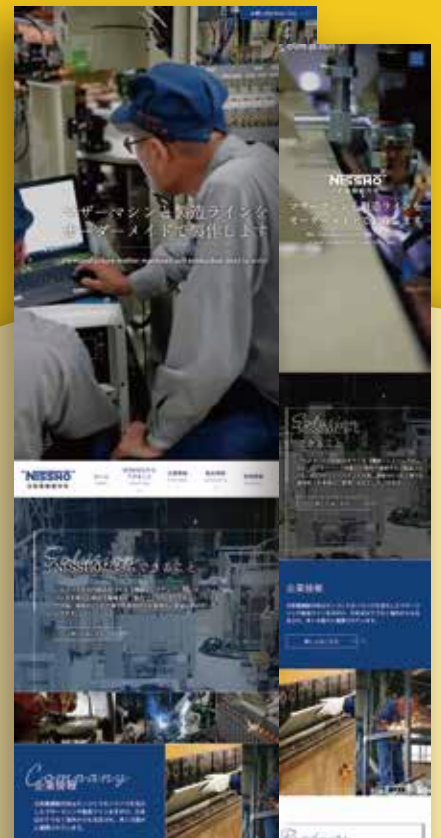
株式会社日昭電機製作所 コーポレートサイト https://www.nissho-denki-mfg.co.jp/