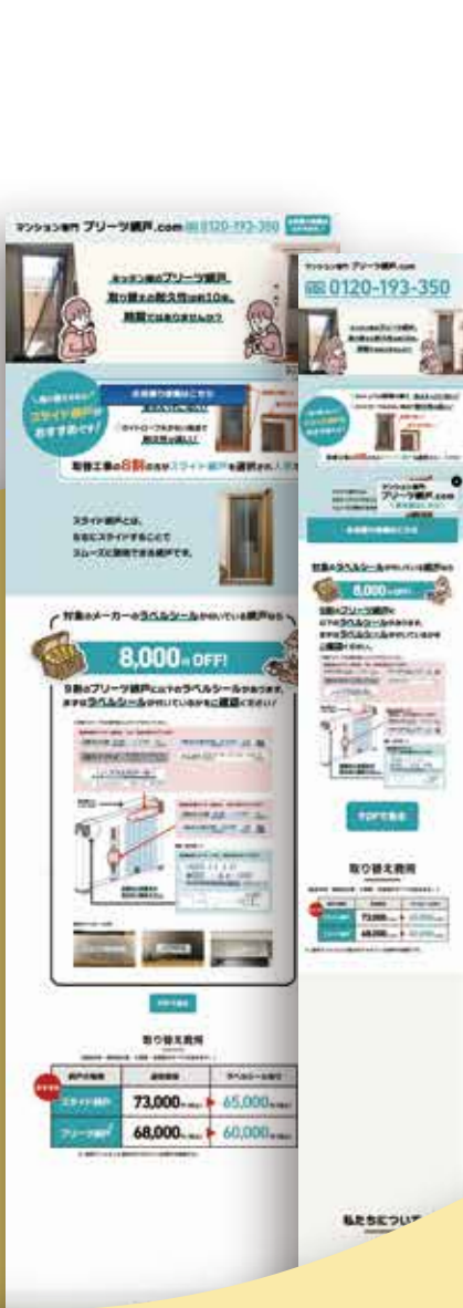
マンション専門 プリーツ網戸.com (株式会社塚本量商店) 製品LPサイト/CMS https://osaka-pleats-amido.com/

Webサイトをはじめ、グラフィックデザインやレポート制作、デジタルブックなど、多様な分野における実績を通じて弊社の制作サービスを ご提供しています。